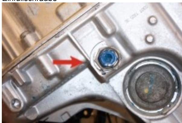
Kontroll- und Ablassschraube